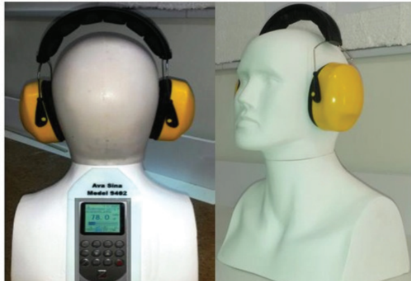
تصویر ۲: تعیین قدرت کاهندگی صدای گوشی با استفاده از مانکن سر مطابق با استاندارد ISO ۳-۴۸۶۹

دستگاه، میزان افت جایگذاری گوشی‌های مورد مطالعه در پهنای فرکانسی یک اکتاو باند محاسبه گردید. در مرحله دوم مطالعه، جهت بررسی کاهندگی گوشی‌ها از مانکن سر مدل AVASINA 9402 با استناد به استاندارد ISO 3-4869 استفاده شد. در استاندارد ذکر شده خصوصیات مانکن سر و میکروفن مورد استفاده ذکر گردیده و همچنین میزان سطح فشار صوت و مدت زمان انجام آزمون بیان گردیده است؛ به طور کلی این بخش از استاندارد روش اندازه گیری افت جایگذاری را برای گوشی‌های ایرماف توسط یک مانکن آکوستیک سر بیان می‌دارد [۱۱]. در تصویر ۱ چگونگی قرار گرفتن افراد در معرض صدای مرجع و اتصال میکروفن داخل گوش را مطابق با استاندارد ISO 11904 نشان می‌دهد. همچنین در تصویر ۲ نیز تصویری از انجام تست بر روی مانکن سر طراحی شده مطابق با استاندارد ISO 3-4869 ارائه گردیده است. داده‌ها با استفاده از نرم افزار SPSS نسخه ۲۱ و آزمون‌های آماری مقایسه میانگین ANOVA مورد تجزیه و تحلیل قرار گرفت.