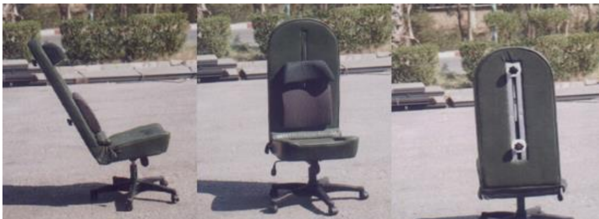
شکل ۳. صندلی ارگونومی ساخته شده، از نماهای مختلف