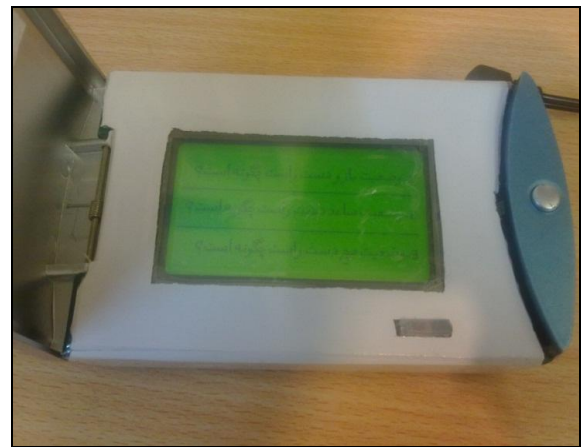
شکل ۴: نمونه‌ای از سوالات ارزیابی پوسچر به روش RULA

در این سیستم ورود داده‌ها توسط فرد ارزیابی کننده با استفاده از صفحه لمسی انجام می‌شود. نمونه‌ای از سوالات در شکل ۴ آمده است.