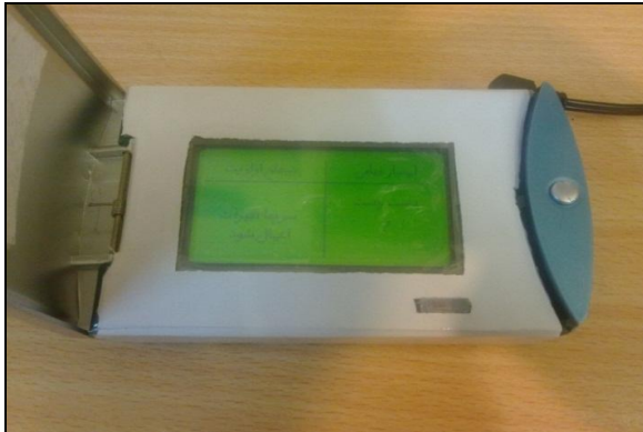
شکل ۵: نمونه‌ای از نتایج نهایی ارزیابی پوسچر به روش RULA

سیستم ۶/۲ \pm ۸۴/۲ بدست آمد که بر اساس مقیاس طبقه‌بندی در رتبه B و محدوده قابل قبول و وضعیت خیلی خوب قرار گرفت. جهت تعیین پایایی نیز آلفای کرونباخ محاسبه شد و مقدار آن ۰/۷۱۶ بدست آمد. همچنین ضریب همبستگی پیرسون بین امتیاز کل دو بار پر کردن پرسشنامه توسط کارشناسان بهداشت حرفه‌ای، برابر ۰/۸۸۸ بدست آمد ( P < ۰/۰۰۱ ).