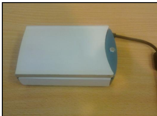
شکل ۳: تصویر PDA

تصویر دستیار دیجیتال شخصی ساخته شده در شکل ۳ آمده است. وزن این سیستم ۳۰۰ گرم و دارای ابعاد ۱۳×۸×۳/۵ سانتی‌متر می‌باشد.