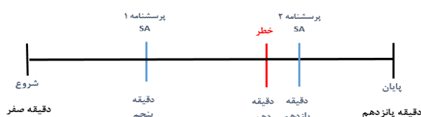
شکل ۲- مراحل انجام آزمایش

شبهه‌ساز رانندگی اتوبوس آکیا Full 301 BI توسط دانشگاه خواجهنصیر ساخته شده است برای ارزیابی عملکرد رانندگان استفاده شد (شکل ۳).