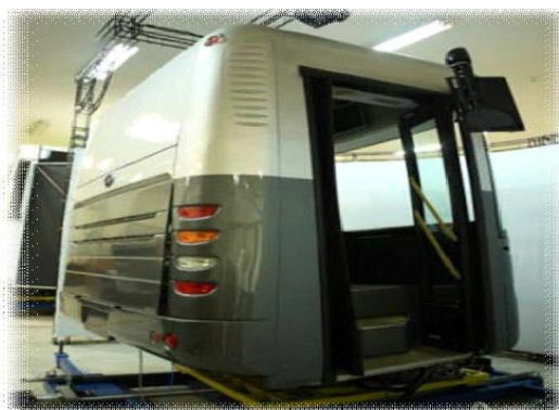
شکل ۳- شبهه‌ساز رانندگی اتوبوس آکیا Full 301 BI