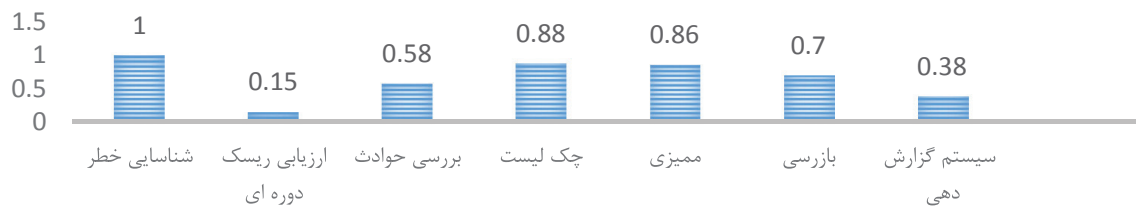
تصویر ۳: تأثیر پذیری فاکتور ارزیابی ریسک