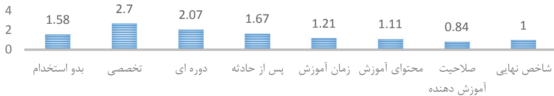
تصویر ۲: تأثیر پذیری فاکتور آموزش