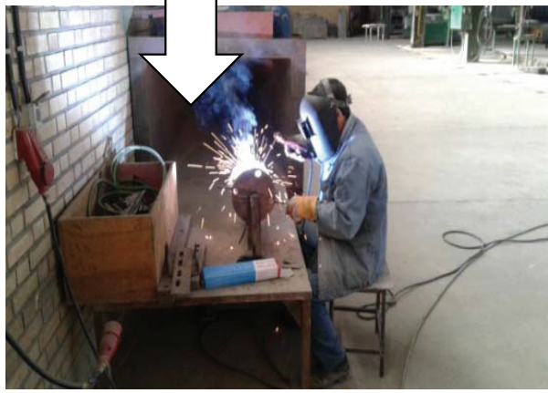
تصویر ۳: جوشکاری قبل و بعد از مداخله