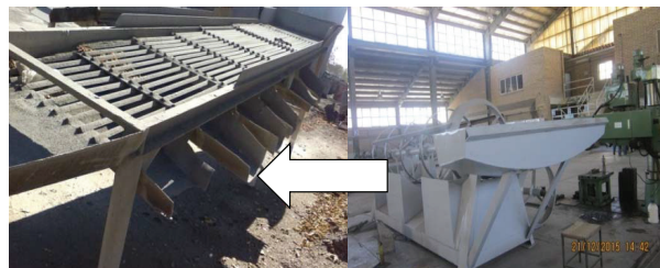
تصویر ۵: گلوله سورت‌کن قبل و بعد از مداخله

قبل و بعد از مداخله را نشان می دهد. در شروع مداخله بیشترین شیوع ناراحتی‌ها در اندام‌های کمر، زانو، گزارش گردید که تمامی افراد آن را ناشی از فشار کار، حمل دستی بار و تردد از پله می‌دانستند. بعد از مداخله شیوع اختلال در نواحی زانو، کمر، شانه، آرنج، مچ دست، پشت و ناحیه باسن ران کاهش معنی‌داری را با توجه به نتایج آزمون مک نمار نشان داد. ضمن این کاهش در نواحی گردن و قوزک پا معنی‌دار نبود.