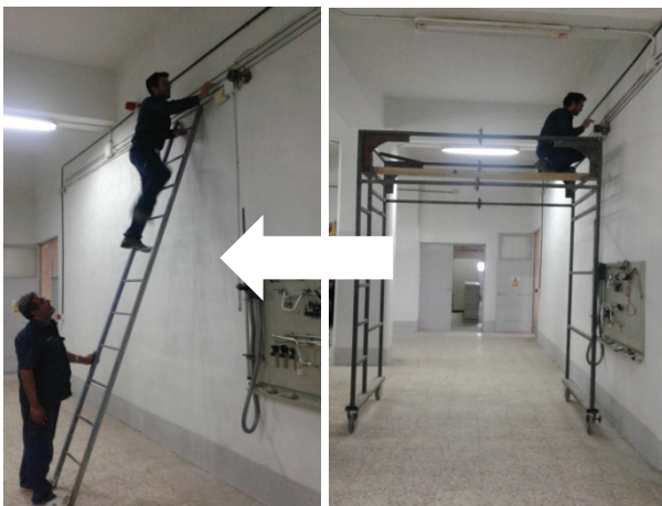
تصویر ۴: جایگاه کار قبل و بعد از مداخله

تصویر ۲: مواجهه با ریسک فاکتور استرس با توجه به ارزیابی سریع مواجهه قبل و بعد از مداخله